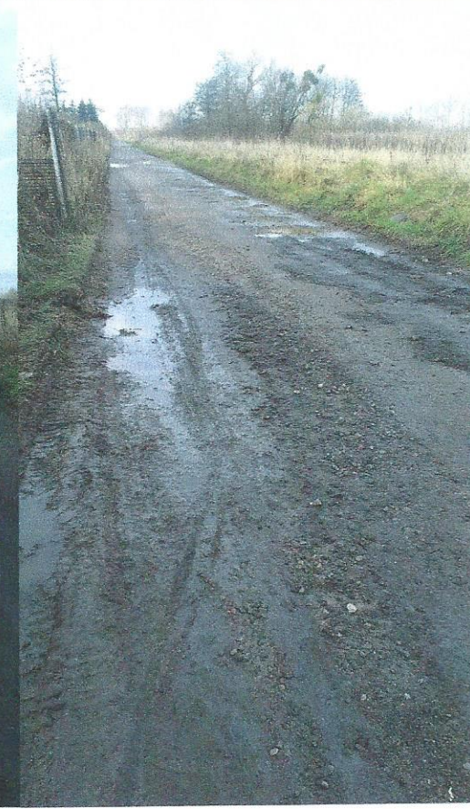
Stan drogi dzień "po naprawie" 24.11.2017