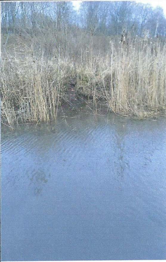
Stan drogi z dnia 28.11.2017